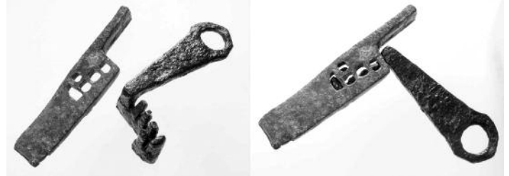
Κλειδί και γλώσσα ρωμαϊκής κλειδαριάς

εφεύρουν ένα σύστημα κλειδώματος με σταθερά σημεία ασφάλειας. Αυτό ήταν ένα τεράστιο άλμα για συστήματα ασφάλειας και κλειδώματος. Και, για να αυξήσουν την ασφάλεια περαιτέρω, χρησιμοποίησαν διάφορα μεγέθη και μορφές εγκοπών έτσι ώστε κάθε κλειδαριά θα απαιτούσε ένα διαφορετικό κλειδί για να το ανοίξει.