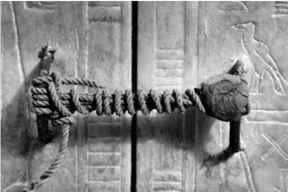
Η "κλειδαριά" στον τάφο του Τουταγχαμών. Είχε μείνει απαραβίαστη για 3250 χρόνια, μέχρι το 1922, που ο τάφος ανακαλύφτηκε.

Το πρώτο ασφαλές σύστημα (χρηματοκιβώτιο), εφευρέθηκε απ' ότι γνωρίζουμε στον 13ο αιώνα π.Χ. Βρέθηκε στον τάφο του Φαραώ Ραμσή II ήταν ένα ξύλινο χρηματοκιβώτιο με ένα σύστημα κλειδώματος όπως αυτό που χρησιμοποιείται σήμερα για τις κλειδαριές με «μπιλίες». Δηλαδή φτιάχτηκε με κινητές «μπιλίες» (ξύλινα κυλινδρικά κομμάτια), που έπεφταν σε αντίστοιχες τρύπες για να κλειδώσουν το χρηματοκιβώτιο. Ένα πολύ εντυπωσιακό επίτευγμα για πάνω από τρεις χιλιάδες χρόνια πριν!