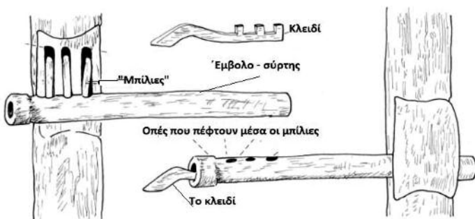
Κλειδαριά από την αρχαία Μεσοποταμία πόρτας, βασισμένη στην Αιγυπτιακή τεχνική